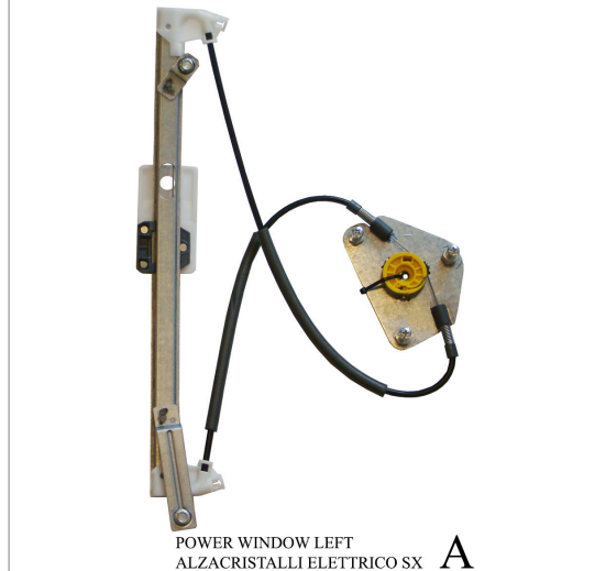
POWER WINDOW LEFT ALZACRISTALLI ELETTRICO SX A

THIS INSTALLATION INSTRUCTION IS FOR BOTH LEFT AND RIGHT SIDE. CETTE INSTRUCTION DE MONTAGE EST POUR LES DEUX COTES DROIT ET GAUCHE. DIESE MONTAGE-ANLEITUNG IST FÜR DIE BEIDE LINKE UND RECHTE SEITE. ESTA INSTRUCCION DE MONTAJE ES PARA LOS DOS LADOS IZQUIERDO Y DERECHO. ESTAS INSTRUÇÕES VALEM TANTO PARA O LADO ESQUERDO QUANTO PARA O DIREITO. LA PRESENTE ISTRUZIONE VALE SIA PER IL LATO SINISTRO CHE PER IL LATO DESTRO.