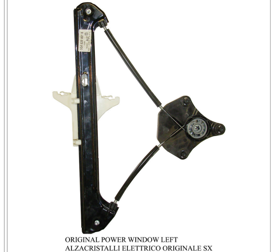
ORIGINAL POWER WINDOW LEFT ALZACRISTALLI ELETTRICO ORIGINALE SX