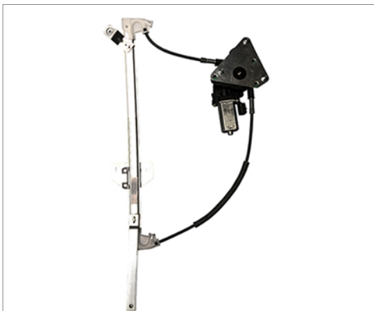
ELECTRIC POWER WINDOW LEFT ALZACRISTALLO ELETTRICO SX

THIS INSTALLATION INSTRUCTION IS FOR BOTH LEFT AND RIGHT SIDE. CETTE INSTRUCTION DE MONTAGE EST POUR LES DEUX COTES DROIT ET GAUCHE. DIESE MONTAGE-ANLEITUNG IST FÜR DIE BEIDE LINKE UND RECHTE SEITE. ESTA INSTRUCCION DE MONTAJE ES PARA LOS DOS LADOS IZQUIERDO Y DERECHO. AS PRESENTES INSTRUÇÕES VALEM TANTO PARA O LADO ESQUERDO QUANTO PARA O DIREITO. LA PRESENTE ISTRUZIONE VALE SIA PER IL LATO SINISTRO CHE PER IL LATO DESTRO.