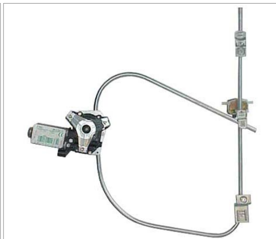
ORIGINAL POWER WINDOW RIGHT ALZACRISTALLI ELETTRICO ORIGINALE DX