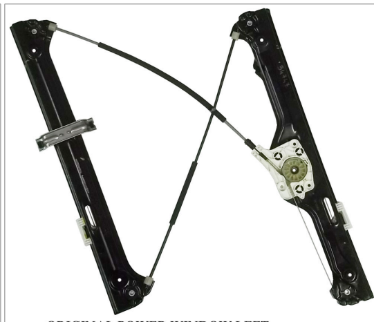
ORIGINAL POWER WINDOW LEFT ALZACRISTALLI ELETTRICO ORIGINALE SX