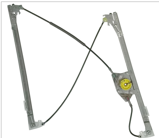
POWER WINDOW LEFT ALZACRISTALLI ELETTRICO SX

THIS INSTALLATION INSTRUCTION IS FOR BOTH LEFT AND RIGHT SIDE. CETTE INSTRUCTION DE MONTAGE EST POUR LES DEUX COTES DROIT ET GAUCHE. DIESE MONTAGE-ANLEITUNG IST FÜR DIE BEIDE LINKE UND RECHTE SEITE. ESTA INSTRUCCION DE MONTAJE ES PARA LOS DOS LADOS IZQUIERDO Y DERECHO. ESTAS INSTRUÇÕES VALEM TANTO PARA O LADO ESQUERDO QUANTO PARA O DIREITO. DEZE AANWIJZINGEN GELDEN VOOR ZOWEL DE LINKER- ALS DE RECHTERKANT. Η ΠΑΡΟΥΣΑ ΟΔΗΓΙΑ ΑΦΟΡΑ ΤΟΣΟ ΤΗΝ ΑΡΙΣΤΕΡΗ ΟΣΟ ΚΑΙ ΤΗ ΔΕΞΙΑ ΠΛΕΥΡΑ. LA PRESENTE ISTRUZIONE VALE SIA PER IL LATO SINISTRO CHE PER IL LATO DESTRO.