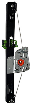
POWER WINDOW LEFT ALZACRISTALLI LEETTRICO SX

THIS INSTALLATION INSTRUCTION IS FOR BOTH LEFT AND RIGHT SIDE. CETTE INSTRUCTION DE MONTAGE EST POUR LES DEUX COTES DROIT ET GAUCHE. DIESE MONTAGE-ANLEITUNG IST FÜR DIE BEIDE LINKE UND RECHTE SEITE. ESTA INSTRUCCION DE MONTAJE ES PARA LOS DOS LADOS IZQUIERDO Y DERECHO. ESTAS INSTRUÇÕES VALEM TANTO PARA O LADO ESQUERDO QUANTO PARA O DIREITO. DEZE AANWIJZINGEN GELDEN VOOR ZOWEL DE LINKER- ALS DE RECHTERKANT. Η ΠΑΡΟΥΣΑ ΟΔΗΓΙΑ ΑΦΟΡΑ ΤΟΣΟ ΤΗΝ ΑΡΙΣΤΕΡΗ ΟΣΟ ΚΑΙ ΤΗ ΔΕΞΙΑ ΠΛΕΥΡΑ. LA PRESENTE ISTRUZIONE VALE SIA PER IL LATO SINISTRO CHE PER IL LATO DESTRO.