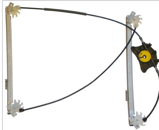
A POWER WINDOW LEFT ALZACRISTALLI ELETTRICO SX

THIS INSTALLATION INSTRUCTION IS FOR BOTH LEFT AND RIGHT SIDE. CETTE INSTRUCTION DE MONTAGE EST POUR LES DEUX COTES DROIT ET GAUCHE. DIESE MONTAGE-ANLEITUNG IST FÜR DIE BEIDE LINKE UND RECHTE SEITE. ESTA INSTRUCCION DE MONTAJE ES PARA LOS DOS LADOS IZQUIERDO Y DERECHO. ESTAS INSTRUÇÕES VALEM TANTO PARA O LADO ESQUERDO QUANTO PARA O DIREITO. DEZE AANWIJZINGEN GELDEN VOOR ZOWEL DE LINKER- ALS DE RECHTERKANT. Η ΠΑΡΟΥΣΑ ΟΔΗΓΙΑ ΑΦΟΡΑ ΤΟΣΟ ΤΗΝ ΑΡΙΣΤΕΡΗ ΟΣΟ ΚΑΙ ΤΗ ΔΕΞΙΑ ΠΛΕΥΡΑ.Α LA PRESENTE ISTRUZIONE VALE SIA PER IL LATO SINISTRO CHE PER IL LATO DESTRO.