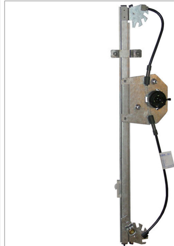
POWER WINDOW LEFT ALZACRISTALLI ELETTRICO SX

THIS INSTALLATION INSTRUCTION IS FOR BOTH LEFT AND RIGHT SIDE. CETTE INSTRUCTION DE MONTAGE EST POUR LES DEUX COTES DROIT ET GAUCHE. DIESE MONTAGE-ANLEITUNG IST FÜR DIE BEIDE LINKE UND RECHTE SEITE. ESTA INSTRUCCION DE MONTAJE ES PARA LOS DOS LADOS IZQUIERDO Y DERECHO. ESTAS INSTRUÇÕES VALEM TANTO PARA O LADO ESQUERDO QUANTO PARA O DIREITO. DEZE AANWIJZINGEN GELDEN VOOR ZOWEL DE LINKER- ALS DE RECHTERKANT. Η ΠΑΡΟΥΣΑ ΟΔΗΓΙΑ ΑΦΟΡΑ ΤΟΣΟ ΤΗΝ ΑΡΙΣΤΕΡΗ ΟΣΟ ΚΑΙ ΤΗ ΔΕΞΙΑ ΠΛΕΥΡΑ. LA PRESENTE ISTRUZIONE VALE SIA PER IL LATO SINISTRO CHE PER IL LATO DESTRO.